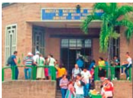
Peligroso. Las autoridades aún no se han pronunciado sobre qué harán con el cocodrilo que atacó al hombre en Ahuachapán.

Desde 1991 Japón a ejecutado en Ahuachapán 38 proyectos, de estos 31 han sido en beneficio a la educación.