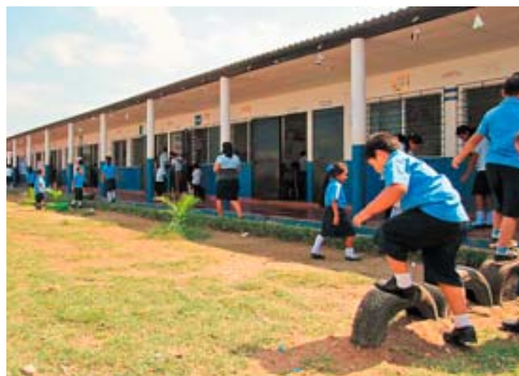
Apoyo. El Gobierno de Japón ha apoyado a Ahuachapán con proyectos de infraestructura educativa y de atención para la salud.

Asimismo, Japón ayudó con la construcción del Centro Escolar Alfredo Espino, en colonia Los Tulipanes, y desembolsó $269,266, mientras que el Ministerio de Educación aportó una contrapartida de